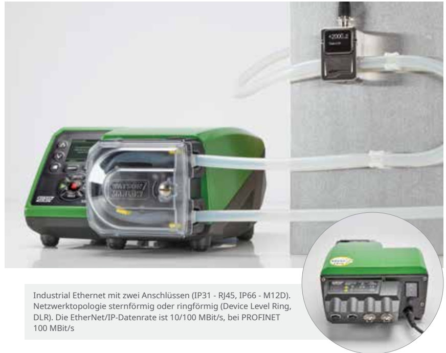
Industrial Ethernet mit zwei Anschlüssen (IP31 - RJ45, IP66 - M12D). Netzwerktopologie sternförmig oder ringförmig (Device Level Ring, DLR). Die EtherNet/IP-Datenrate ist 10/100 MBit/s, bei PROFINET 100 MBit/s