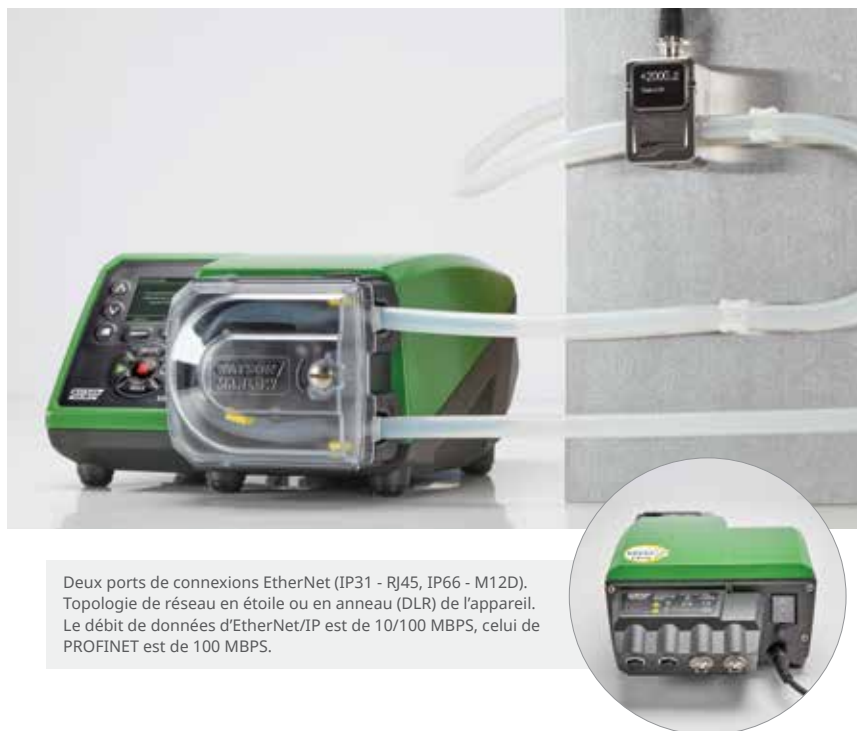
Deux ports de connexions EtherNet (IP31 - RJ45, IP66 - M12D). Topologie de réseau en étoile ou en anneau (DLR) de l'appareil. Le débit de données d'EtherNet/IP est de 10/100 MBPS, celui de PROFINET est de 100 MBPS.