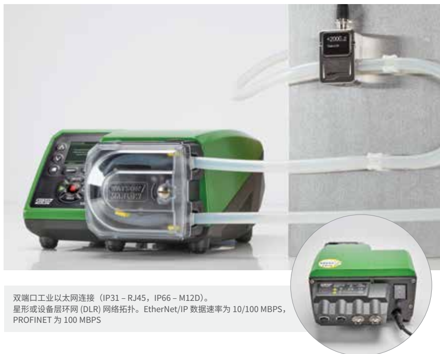
双端口工业以太网连接 (IP31 – RJ45, IP66 – M12D)。星形或设备层环网 (DLR) 网络拓扑。EtherNet/IP 数据速率为 10/100 MBPS, PROFINET 为 100 MBPS